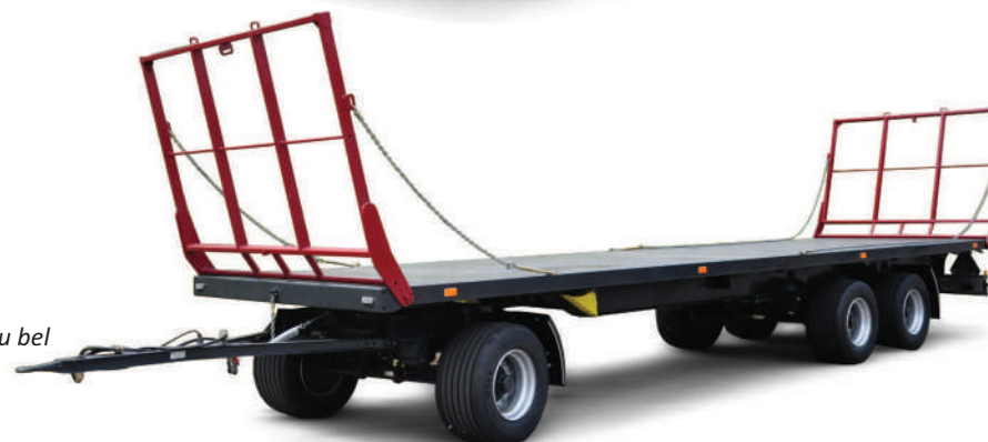
Przyczepa do przewozu bel ZASŁAW D-746-20 20 TON