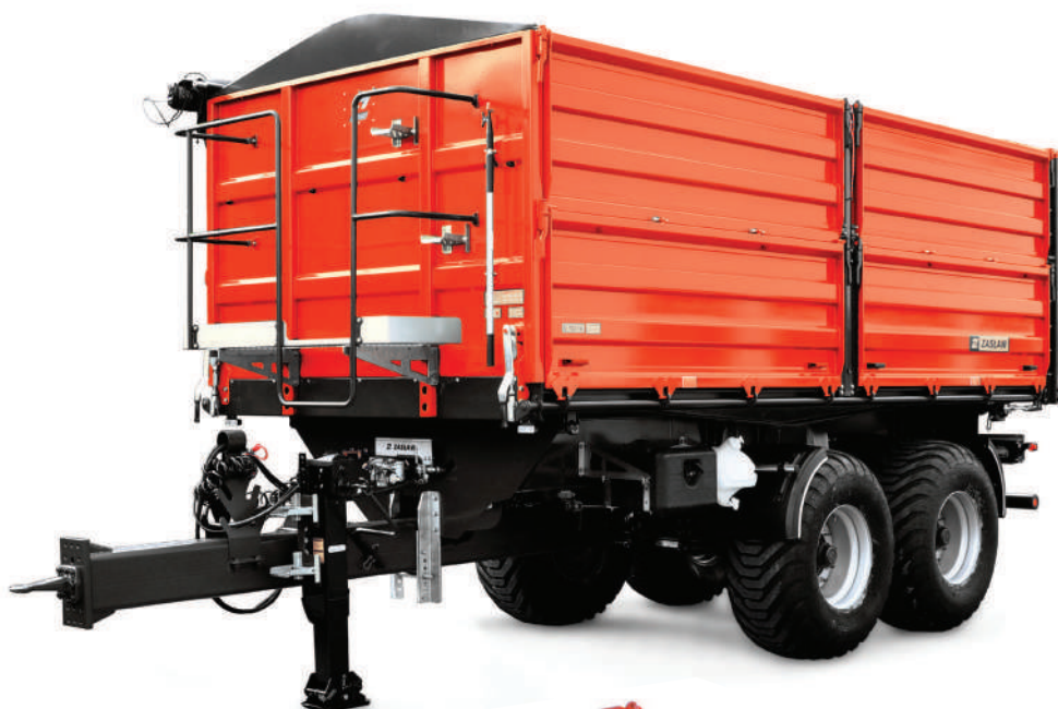
Przyczepa rolnicza ZASŁAW D-762-14 XL