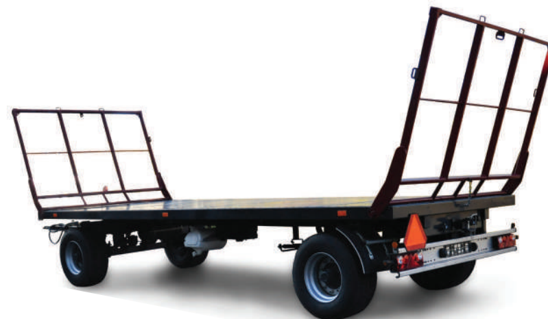
Przyczepa do przewozu bel ZASŁAW D-744-13 13 TON