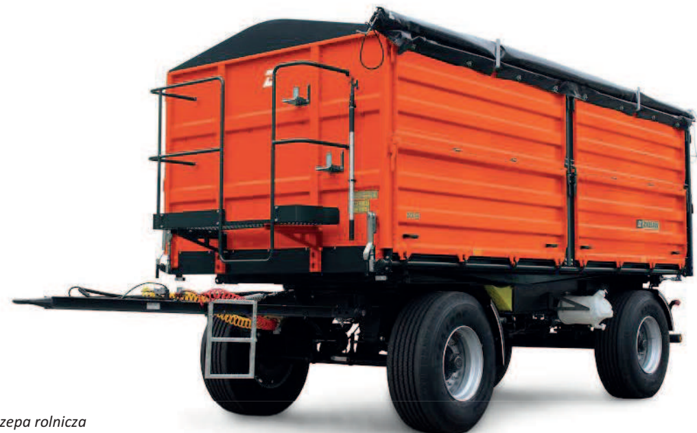
Przyczepa rolnicza ZASŁAW D-737AA-14t XL pojemność 20,1 m 3