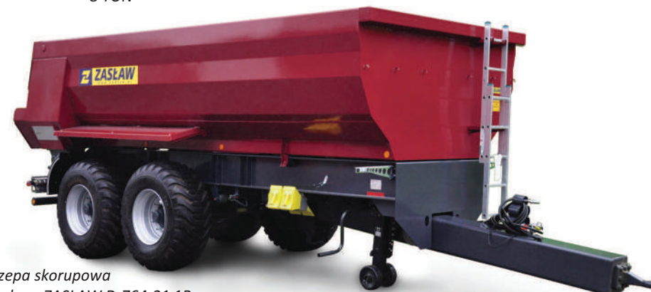
Przyczepa skorupowa budowlana ZASŁAW D-764-21 1B 21 TON