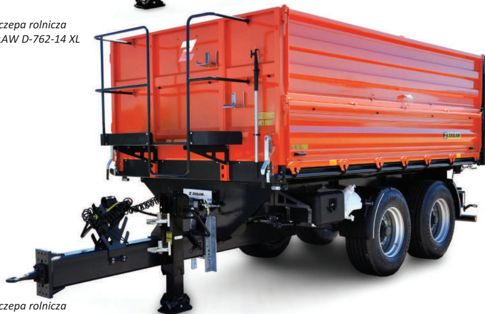
Przyczepa rolnicza ZASŁAW D-762-12k