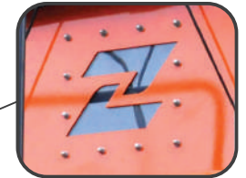
Okno dla operatora