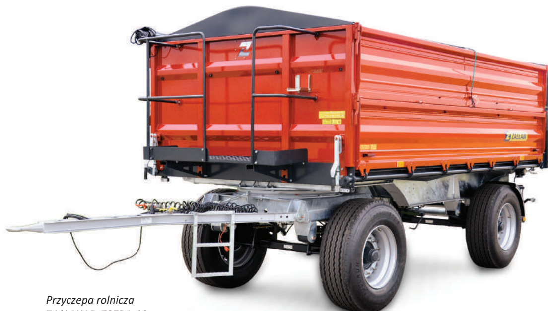
Przyczepa rolnicza ZASŁAW D-737BA-10