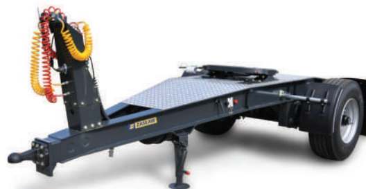
Wózek DOLLY ZASŁAW 385/65R22,5