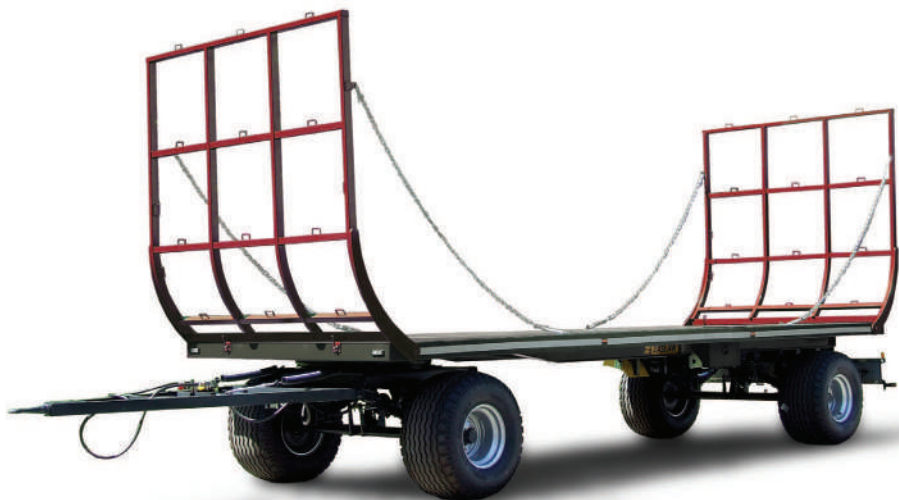
Przyczepa do przewozu bel ZASŁAW D-744-9 9 TON