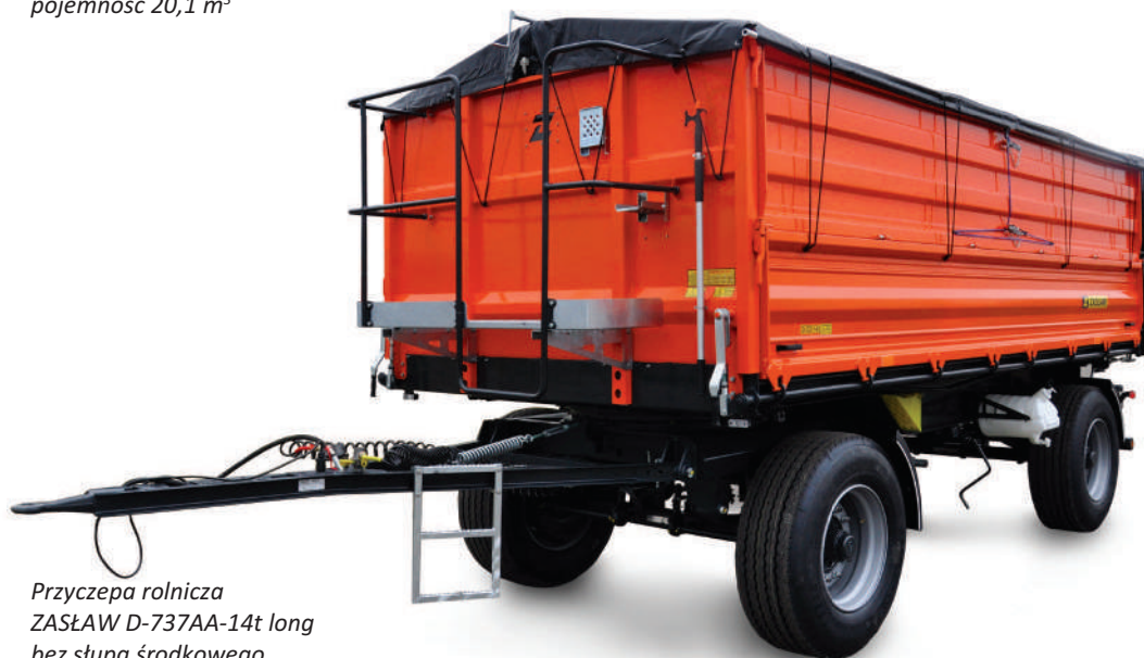
Przyczepa rolnicza ZASŁAW D-737AA-14t long bez słupa środkowego