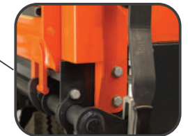
Ściana oparta o przednie obrzeże - podwyższona stabilność ściany

Nowa podłoga z arkusza blachy o grubości aż 5 mm, wykonywana na robocie spawalniczym. Obrzeża podłogi walcowane co zapewnia sztywność i precyzję wykonania