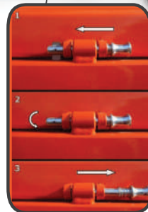
Nowy układ łączników pomiędzy pierwszą a drugą burtą