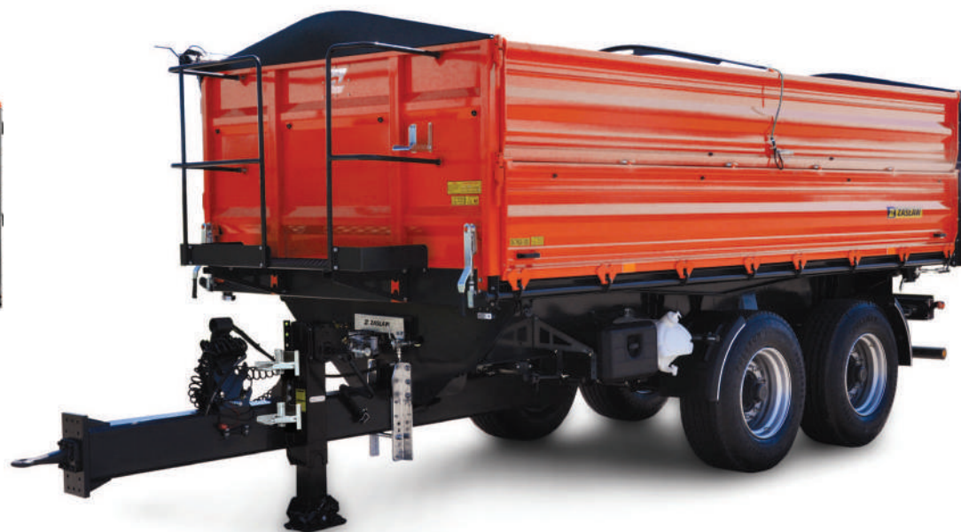
Przyczepa rolnicza ZASŁAW D-762-12 long