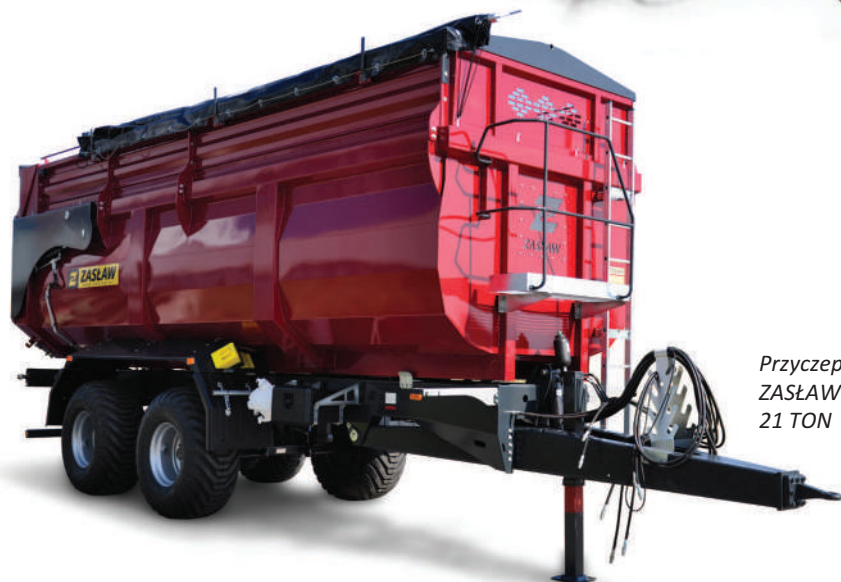
Przyczepa skorupowa rolnicza ZASŁAW D-764-21 1R 21 TON