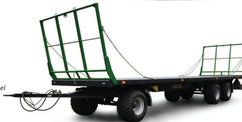
Przyczepa do przewozu bel ZASŁAW D-745-14 14 TON