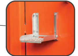
Zewnętrzne i wewnętrzne stopnie na przedniej ścianie